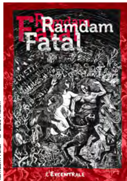
Ramdam Fatal