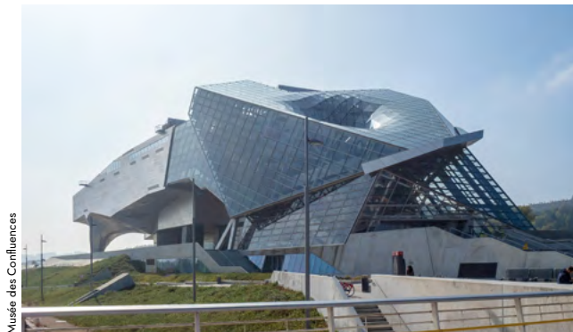
Musée des Confluences

Judi 9 juin, à partir de 20h. La soirée concert est organisée en collaboration avec le Musée des Confluences, le CMTRA et la FAMDT. Gratuit pour les adhérent.e.s de la FAMDT.